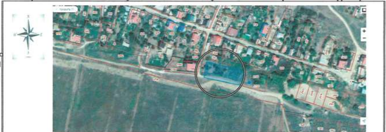
Выкопировка из публичной кадастровой карты